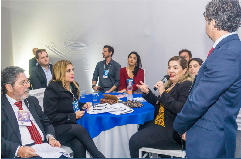
As Rodas de Conversa permitiram que profissionais trocassem experiências sobre diversos temas do mundo empresarial

empreendedor. Foram seis rodas, onde os presentes nestes bate-papos puderam debater e sanar dúvidas com profissionais das mais diversas áreas, sobre temas como carreira 4.0, marketing digital, IOF sobre exportação, diversidade e inovação, leis trabalhistas e sobre licitações públicas. Já nos três painéis, foi possível conferir dicas de como se estabelecer na Indústria 4.0, empreendedorismo feminino e startups.