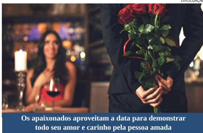
Os apaixonados aproveitam a data para demonstrar todo seu amor e carinho pela pessoa amada

Para as pessoas mais românticas, não há coisa melhor do que programar uma noite especial a dois. Diversos estabelecimentos, principalmente restaurantes e churrascarias, preparam suas noites para receber os apaixonados, com decoração temática, cardápio especial, música ao vivo e espaços reservados. E que tal completar a noite com um mimo? Neste caso, a dica é presentear com um óculos de sol, que pode ser encontrado nos mais variados modelos como os aviador, moda praia, redondos e vintage, em