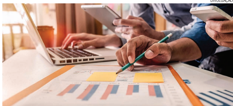
O Simples Nacional surge como um facilitador para o empresário, unindo os principais tributos e contribuições do País

Os órgãos públicos têm desenvolvido ações e programas que visam facilitar e desburocratizar a vida do empresário e empreendedor brasileiro. Um destes regimes tributários é o Simples Nacional,