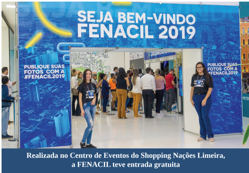
Realizada no Centro de Eventos do Shopping Nações Limeira, a FENACIL teve entrada gratuita

Em sua primeira edição, a Feira de Empreendedorismo e Negócios da ACIL (FENACIL), já havia sido um sucesso e mostrado o grande potencial que a cidade possui. Em 2019, muito mais do que exibir uma marca, as empresas participantes puderam potencializar a sua rede de contatos, aprimorar seus conhecimentos através das palestras, compartilhar experiências através das relações desenvolvidas e das rodas de conversas, além de terem a oportunidade de firmarem novas parcerias.