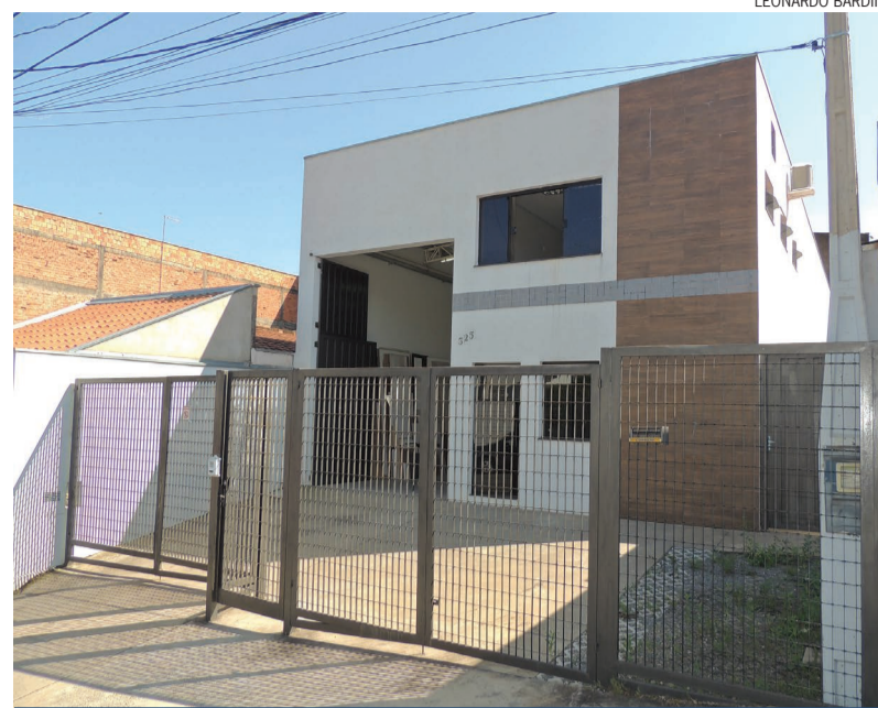
Na Home Móveis Planejados são desenvolvidos projetos personalizados, atendendo as necessidades de cada cliente

A empresa convida todos para conhecerem seu trabalho. Além de qualidade garantida, ainda oferece diversas formas de pagamento facilitados, como cartões, cheque ou boletos. A Home Móveis Planejados atende na Rua Wilson Benedetti, 325, no Jardim Glória. Mais informações ou agendamentos de visita no telefone (19) 3703-4025, WhatsApp (19) 98197-5337 ou e-mail contato@homemoveisplanejados.com.