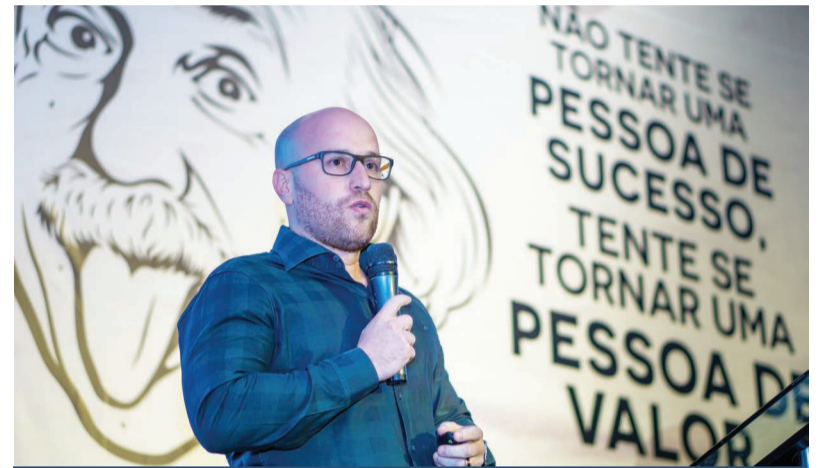
42 profissionais especialistas palestraram na FENACIL