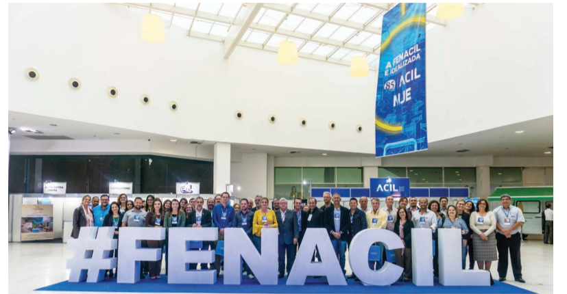
A FENACIL recebeu o encontro da RA7, grupo de associações comerciais de Campinas