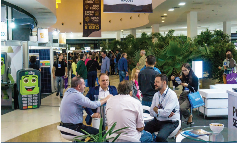
Os 80 expositores do evento tiveram a oportunidade de realizar novos negócios, parcerias e fortalecer sua marca

esta interação, foi desenvolvido um game dentro do próprio aplicativo, que no final rendeu dez premiações. Poderiam participar do jogo somente visitantes. Cada interação com posts e produção de conteúdo rendeu uma pontuação, e com base no total de pontos foi gerado um ranking entre os usuários para a entrega dos prêmios, oferecidos pelos próprios expositores da feira. Foram diversas recompensas, entre elas seis meses de Carro Fácil, uma bolsa de estudos para o curso de idiomas, ca-