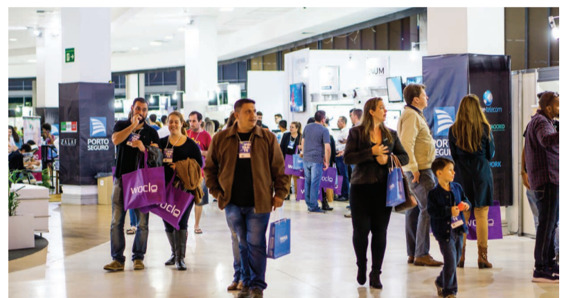
Realizada durante três dias, a FENACIL contou com a visita de mais de 4 mil pessoas

“O evento foi muito bem planejado, não deixando nada a desejar em termos de estrutura e organização. Nosso estande foi muito visitado pelo público, nosso novo serviço a TV por assinatura foi bem divulgado de forma que o público interagiu com as atividades propostas, atingindo assim nossa meta de fazer conhecida nossa marca e qualidade de serviços. Em contato com outros empresários participantes da feira recebemos vários elogios a respeito do nosso espaço e atendimento prestado a todos. Acredito que a FENACIL tenha sido um marco para nós da Network Telecomunicações, por toda nossa estrutura e reconhecimento dos visitantes em nosso estande e também pela receptividade do público com nosso novo produto, que é a nossa TV com tecnologia em fibra ótica”.