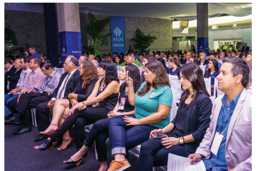
A abertura da FENACIL contou com a presença de convidados e autoridades

As Rodas de Conversas e painéis interativos apresentaram temas relevantes e que impactam diariamente a vida do