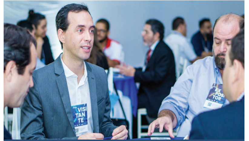
As três Rodadas de Negócios promovidas durante a feira contaram com a presença de 75 empresários