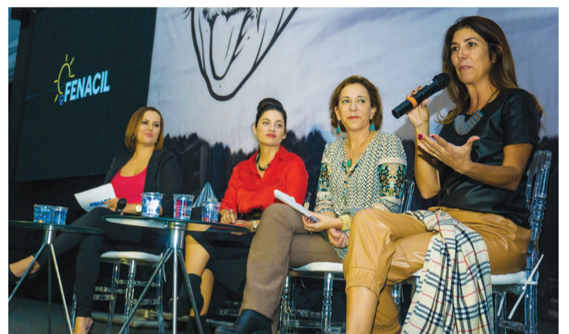
Três painéis compuseram a programação da feira, entre eles o de Empreendedorismo Feminino

“Me surpreendeu! Já estive em diversas feiras de vários segmentos como agrícolas, máquinas e ferramentas, embalagens, alimentos, suplementos, etc., todas em grandes centros urbanos e a FENACIL não deixou nada a desejar. Muito pelo contrário, a organização estava impecável, a disposição dos estandes, a tecnologia aplicada estava excelente, ou seja, apesar de ser uma feira pequena perto dessas citadas, estava com muito conteúdo, proporcionando diversas oportunidades de negócios, que acredito ser o maior intuito dela, além das palestras sensacionais. A ACIL está de parabéns pela FENACIL 2019 e que venham muitas outras”.