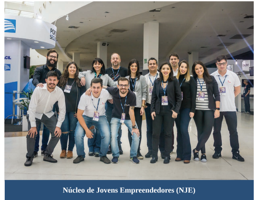
Núcleo de Jovens Empreendedores (NJE)

Para a segunda edição da FENACIL, foi preparada uma programação de ponta que contou com a presença de 42 profissionais especialistas de diversos segmentos. Quem prestigiou o evento teve a oportunidade de participar de palestras, com as mais diferentes temáticas, direcionadas para diversas áreas do mercado, que foram distribuídas entre as Arenas de Negócios